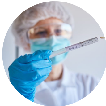
Dépistage des personnels et des élèves ?