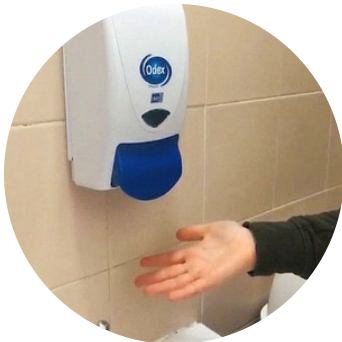
Présence de savon liquide en permanence ?

Pour rappel, l'employeur a une obligation de résultats en matière de santé et sécurité au travail pour les personnels comme pour les élèves. L'administration engage donc sa responsabilité juridique en cas de manquement à son devoir de protection et il faut donc le lui rappeler afin qu'il prenne les mesures nécessaires (Article 2-1 du Décret 82-453 relatif à l'hygiène et à la sécurité du travail ainsi qu'à la prévention médicale dans la fonction publique).