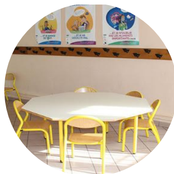
Protocole pour les gestes barrières dans l'établissement et la cantine ?