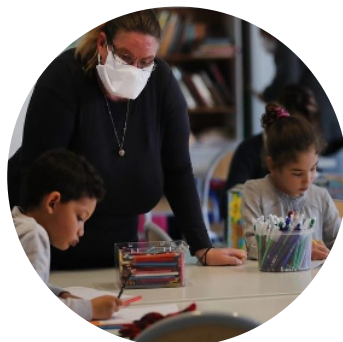
Effectifs réduits dans les classes ?