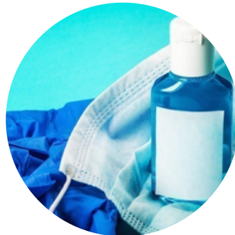
Présence de masques, gants et gel hydroalcoolique en quantité ?