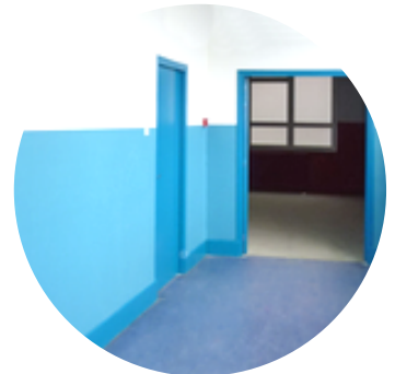
Distanciation sociale et déplacements dans les locaux ?