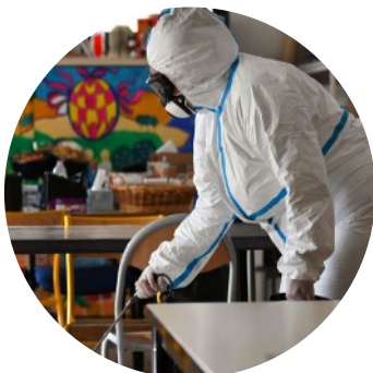
Désinfection fréquente des locaux ? Désinfection des personnels ayant pris les transports ?